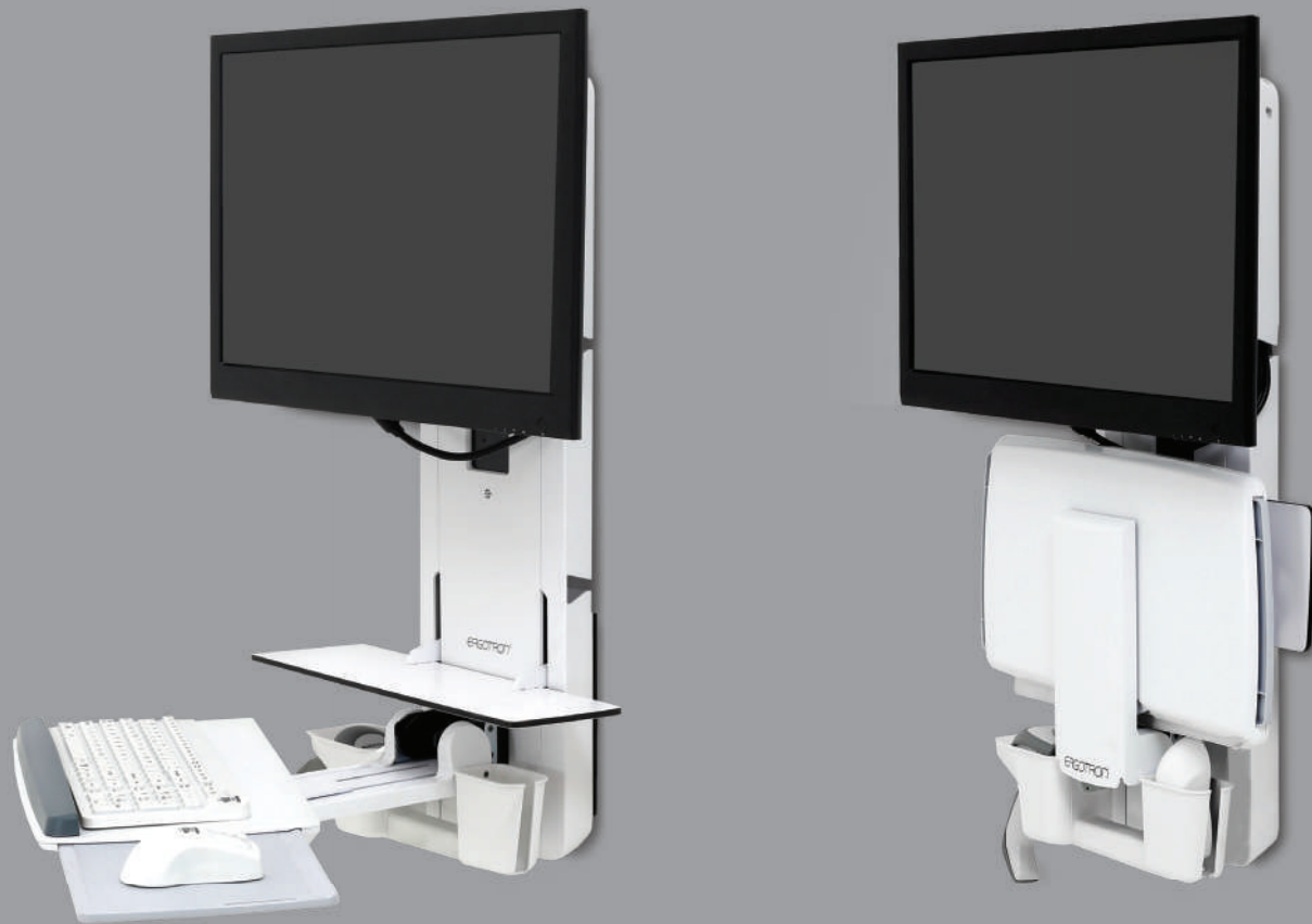
StyleView Vertical Lift

Bringen Sie die Technologie in stark frequentierte Pflegebereiche