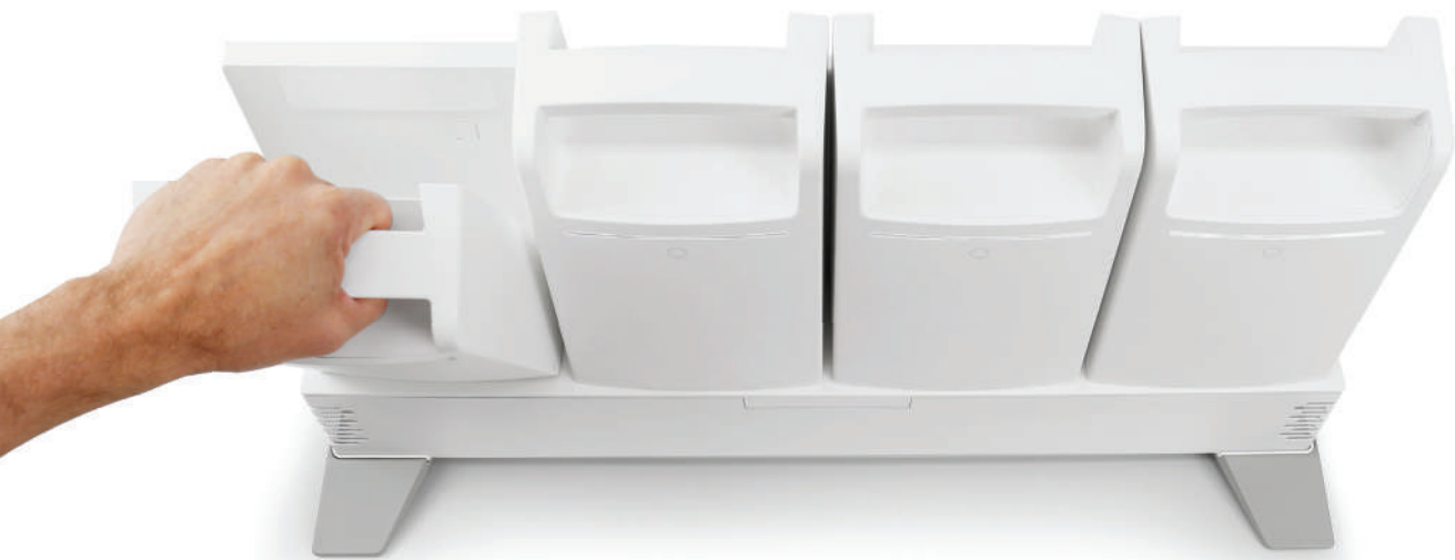
LiFeKinnex 4-Fach-Ladegerät (Desktop)

Ein energiereicher Arbeitsablauf auf den Sie sich verlassen können