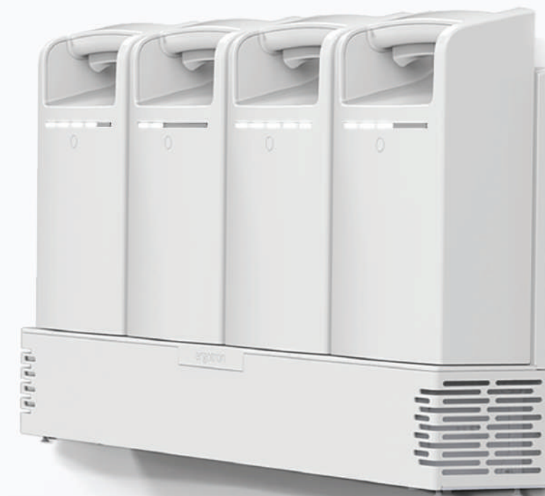
LiFeKinnex 4- Fach-Ladegerät (Wandmontage)

Überwacht die Batterielaufzeit mithilfe einer Leuchtanzeige auf dem Dashboard