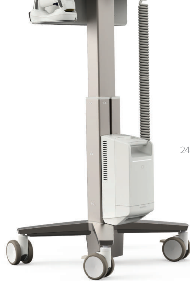
LiFeKinnex 245 Wh Batterie