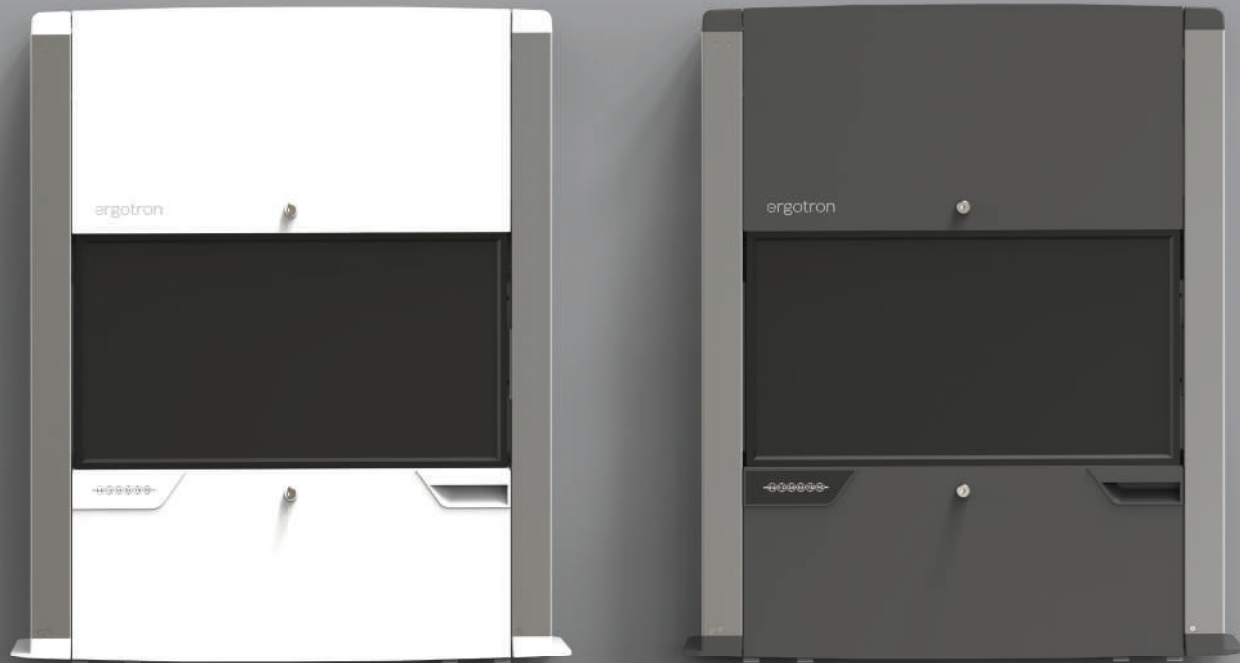
CareFit Gehäuse mit schlankem Profil