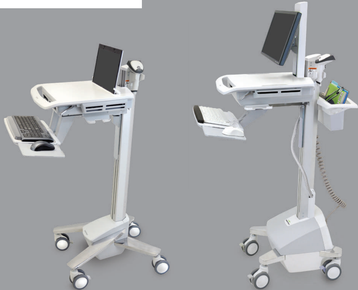
StyleView Visiten- und Laptopwagen, mit und ohne Akku