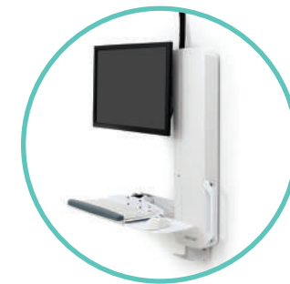
Tastaturablage mit automatischem Einzug

Ergonomisch, kompakte Wandhalterung Kompatibel mit der meisten IT-Ausstattung, auch für All-in-One Computer Dual-Monitorlösung verfügbar