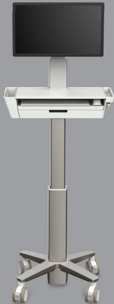
CareFit Slim LCD 2.0