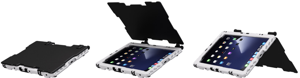
Sunshade aiShell 8: #297110 Sunshade aiShell 9.7: #291018 Sunshade aiShell 10/10.9/11: #298590 Sunshade aiShell 12: #298611

DE Die Magnet Füße werden anstelle der Gummifüße auf der Rückseite des Gehäuses angebracht. Sie sind stark genug, um das Shell™ auf ferromagnetischen Flächen sicher zu befestigen. Bringen Sie den kleineren der 4 Magneten neben der Kamera an, damit diese weiterhin genutzt werden kann.