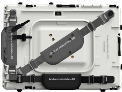
Shell handstrap back: #293007