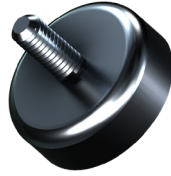
Magnetic Feet: # 293009

EN The magnetic feet are attached to the back of the case instead of the rubber feet. They are strong enough to securely attach the Shell™ to ferromagnetic surfaces. Attach the smaller of the 4 magnets next to the camera so that it can still be used.