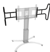
Zwei große, stabile Griffe