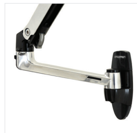
LX-VERLÄNGERUNG ERHÖHT DIE REICHWEITE UM 23 CM. WEIß (45-289-216) POLIERTES ALUMINIUM (45-289-026) MATTSCHWARZ (45-289-224)