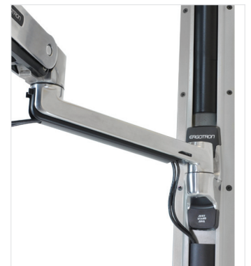
EMPFOHLEN: BEFESTIGEN SIE DEN MONITOR ARM MIT DER HALTERUNG (97-091) AN EINER ERGOTRON-WANDSCHIENE.