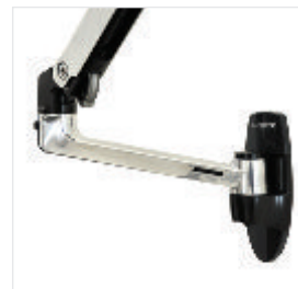
LX-VERLÄNGERUNG ERHÖHT DIE REICHWEITE UM 23 CM. POLIERTES ALUMINIUM (45-289-026) MATTSCHWARZ (45-289-224)