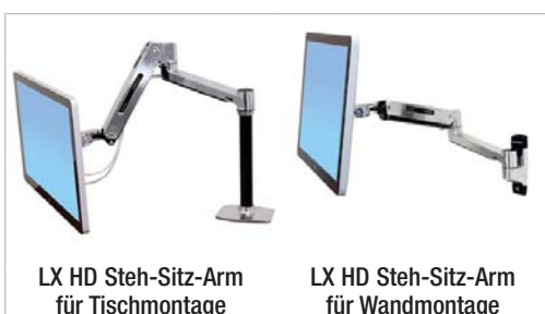
LX HD Steh-Sitz-Arm für Tischmontage