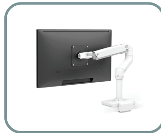
LX Monitorarm, Tischklemme für Schiebepplatten mit schlankem Design 45-608-216 (Weiß) 45-608-224 (Matt-Schwarz)