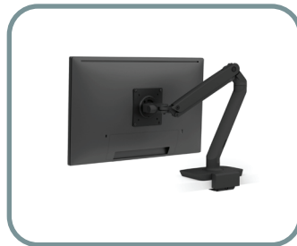
MXV Monitorarm, Tischklemme für Schiebepplatten mit schlankem Design 45-607-216 (Weiß) 45-607-224 (Matt-Schwarz)