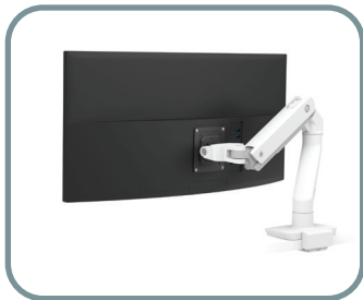
HX Monitorarm, Tischklemme für Schiebepplatten mit schlankem Design 45-606-216 (Weiß)