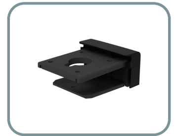
Tischklemme für Schiebepplatten mit schlankem Design, 25–35 mm 98-479-216 (Weiß) 98-479-224 (Matt-Schwarz)

Weiterführendes Informationsmaterial zum Herunterladen finden Sie unter ergotron.com/pro