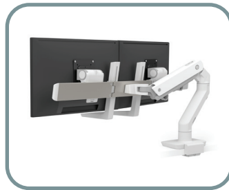
HX-Dual-Monitorarm, Tischklemme für Schiebepplatten mit schlankem Design 45-611-216 (Weiß)