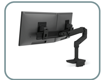
LX Dual Direct Monitorarm, Tischklemme für Schiebepplatten mit schlankem Design 45-609-216 (Weiß) 45-609-224 (Matt-Schwarz)