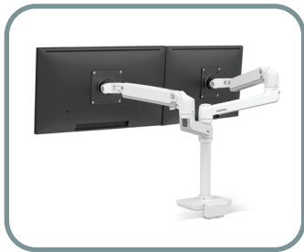
LX Dual Monitorarm mit hoher Säule, Tischklemme für Schiebepplatten mit schlankem Design 45-610-216 (Weiß) 45-610-224 (Matt-Schwarz)