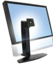
Neo-Flex-Stand für Widescreen Displays