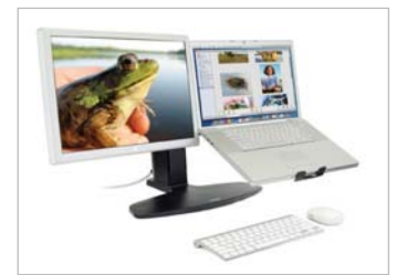
Neo-Flex Combo-Standfuß für ein Display neben einem Laptop-Computer, das sich links oder rechts davon befinden kann. Mit einer separaten Tastatur und Maus verwenden (nicht enthalten)

© 2014 Ergotron, Inc. rev. 18/09/2014/DE Literature made in US Der Inhalt unterliegt nicht angekündigten Änderungen