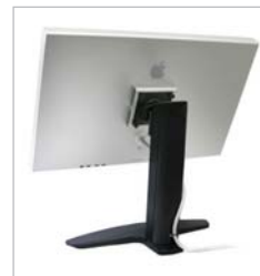
Neo-Flex Standfuß für Breitbildmonitore für ein großes Display bis 32" und Höhenverstellung von 13 cm (5")