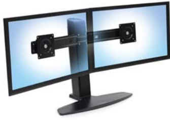
Neo-Flex Lift Stand für zwei Monitore