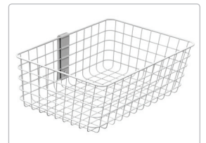
SV Drahtkorb, groß

© 2019 Ergotron, Inc. 05/30/2019-DE Informationsmaterial hergestellt in den U.S.A. Die Geräte von Ergotron sind nicht für Heilung, Behandlung, Linderung oder Vorbeugung von Krankheiten bestimmt. StyleView ist in den Vereinigten Staaten von Amerika und China eine eingetragene Marke von Ergotron. Der Inhalt kann jederzeit und ohne Ankündigung geändert werden.