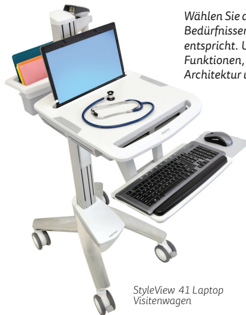
StyleView 41 Laptop Visitenwagen

Wählen Sie den medizinischen StyleView Gerätewagen, der Ihren Bedürfnissen, Ihrem Stil und Ihrem Arbeitsablauf am besten entspricht. Unsere marktführenden StyleView-Wagen bieten alle Funktionen, die sich Pflegekräfte wünschen sowie die offene Architektur und Bauqualität, die IT-Abteilungen fordern.