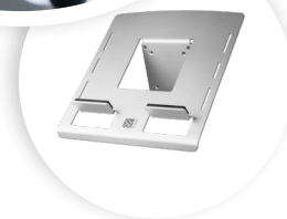
R-GO MORELIA LAPTOP-HALTERUNG