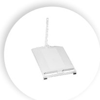
R-GO MORELIA DOCUMENTENHALTER