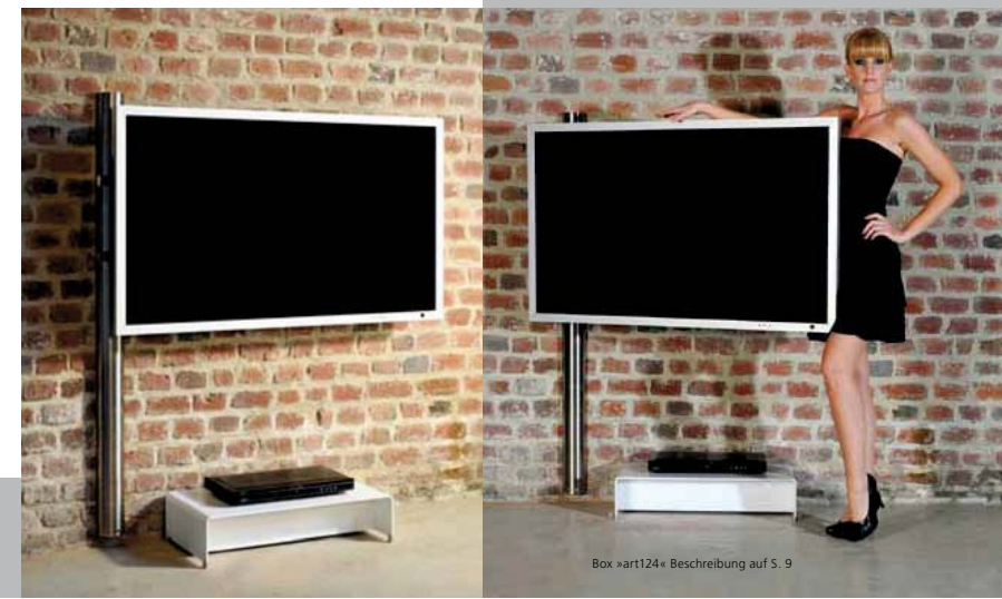
Box »art124« Beschreibung auf S. 9