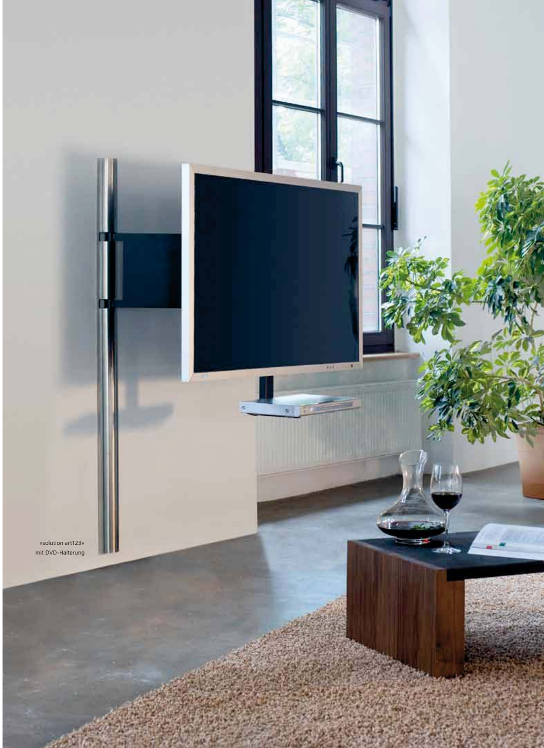
»solution art123« mit DVD-Halterung